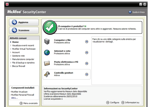
Łatwa w obsłudze, intuicyjna konsola zabezpieczeń

Uwaga: do zainstalowania oprogramowania zabezpieczającego oraz pobierania automatycznych aktualizacji i uaktualnień w celu uzyskania najnowszych rozwiązań dotyczących ochrony wymagane jest połączenie z Internetem.