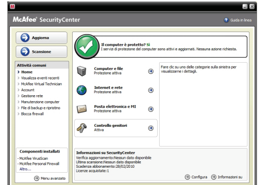
Łatwa w obsłudze, intuicyjna konsola zabezpieczeń

Uwaga: do zainstalowania oprogramowania zabezpieczającego oraz pobierania automatycznych aktualizacji i uaktualnień w celu uzyskania najnowszych rozwiązań dotyczących ochrony wymagane jest połączenie z Internetem.