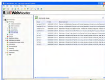
Monitors user online activity