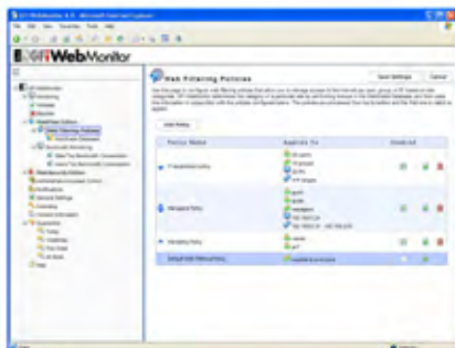
Manage web access based on configurable web filters