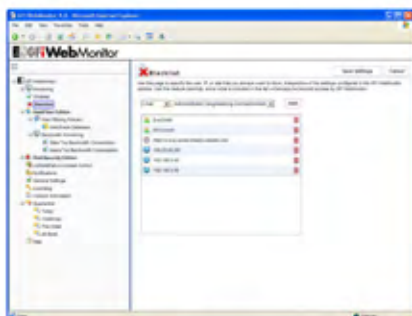
User, IP and URL blacklists